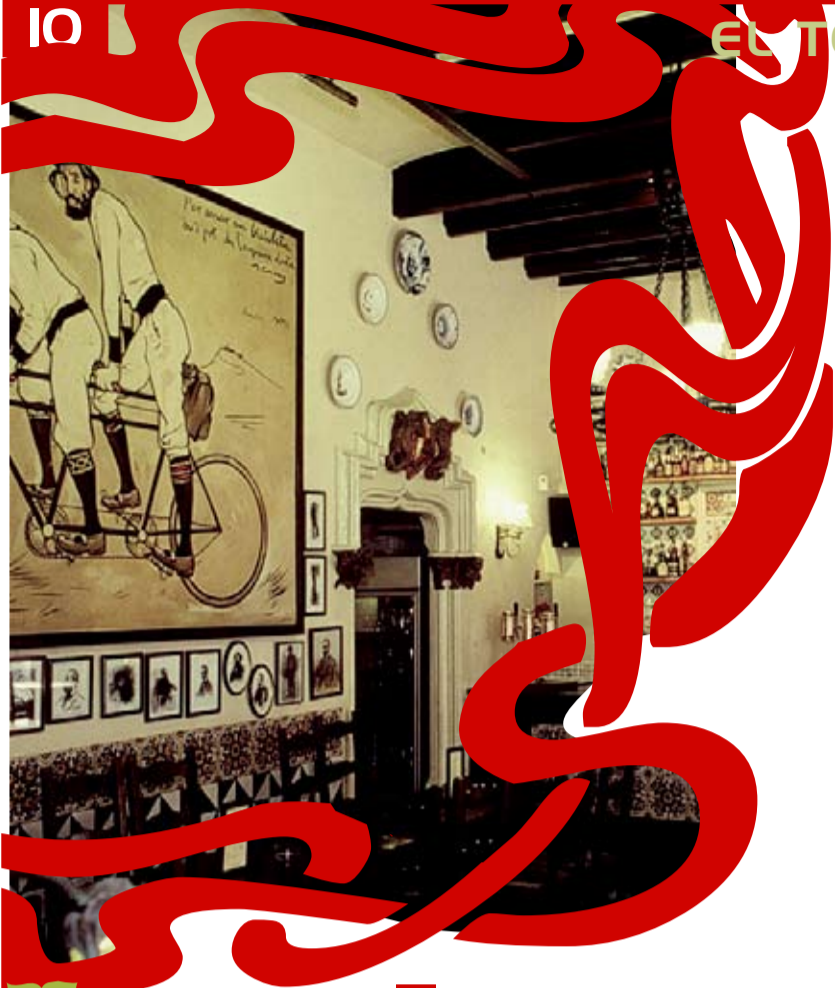
Els Quatre Gats