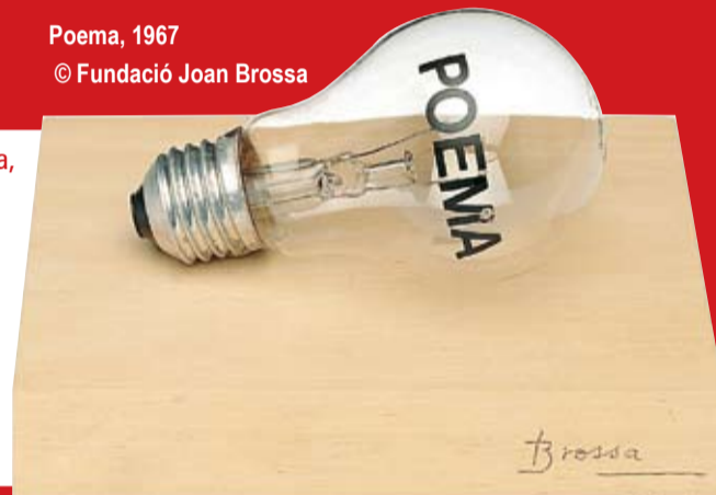
Poema, 1967