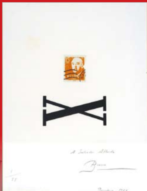
Miralls, 1982